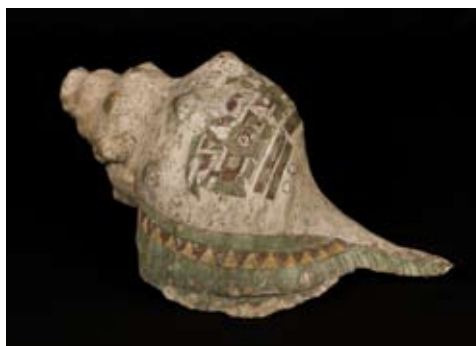
Conque stuquée

Après une exploration des pyramides de Teotihuacan (exposition jusqu'au 24 janvier 2010), puis des collections mexicaines du musée, les élèves deviennent des archéologues en herbe !