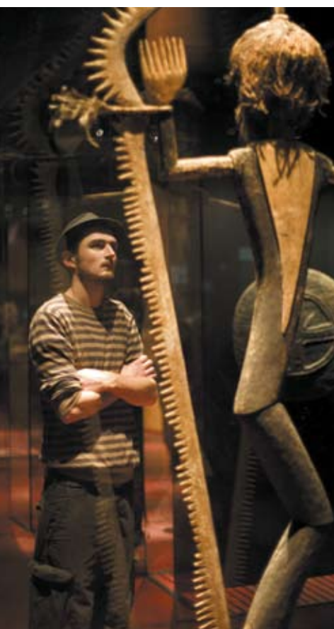
Visiteur du musée du quai Branly. Le plateau des collections

Masques de danse, de guérison ou d'exorcisme : un apprentissage des surprises et secrets réservés aux seuls initiés !