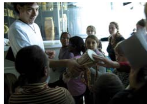
Atelier dans tous les sons, 4 novembre 2008

La e-mallette «Des images pour penser l'Autre, du mythe du bon sauvage à l'Exposition coloniale de 1931» propose un corpus de documents utiles pour préparer un cours, nourrir un débat ou servir de base à des travaux d'élèves. C'est également un espace de dialogue et d'échanges puisque les restitutions pédagogiques pourront s'intégrer à cet outil.