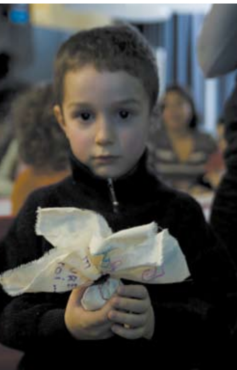
L'Afrique démasquée : L'objet magique, février 2009

Pour une visite plus agréable, les principales règles de visites sont rappelées sur ces fiches et le site.