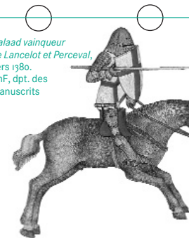
> Galaad vainqueur de Lancelot et Perceval, vers 1380. BnF, dpt. des Manuscrits