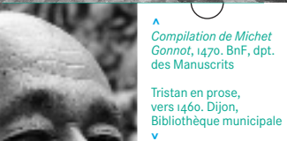
▲ Compilation de Michel Gonnat, 1470. BnF, dpt. des Manuscrits