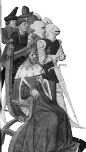
Tristan en prose, vers 1460. Dijon, Bibliothèque municipale