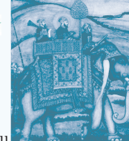
Portrait présumé de Muazzam Bahadur Shah, fin XVII e s.

Pour en savoir plus // Nadine Berca 01 53 79 47 20 // nadine.berca@bnf.fr