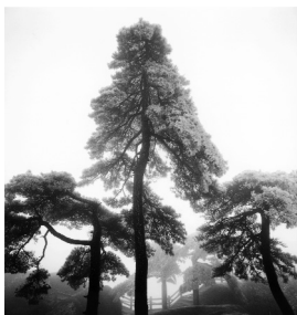
Michael Kenna, Huangshan Mountains, Study 14. BnF, dpt. Estampes et photographie © M. Kenna, 2009